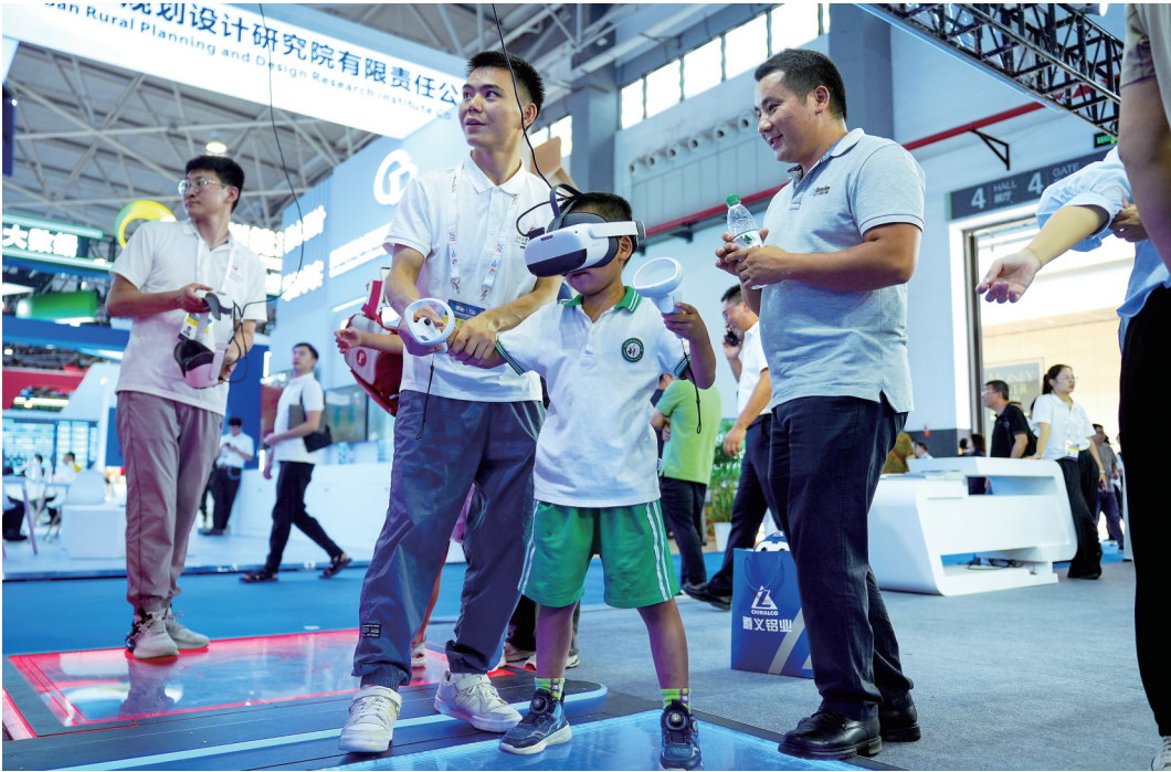
在2024中国国际大数据产业博览会上，一名小朋友体验VR项目。

本届数博会鼓励和支持企业主导举办行业交流活动、特色活动，预计各类活动将达到90余场，包括25场行业交流活动、20余场系列特色活动以及数十场发布活动等。其中，行业交流活动聚焦国际数据空间、数字人才培养、智慧城市、人工智能等主题；成果发布活动包含十大领先科技成果和57项优秀科技成果。