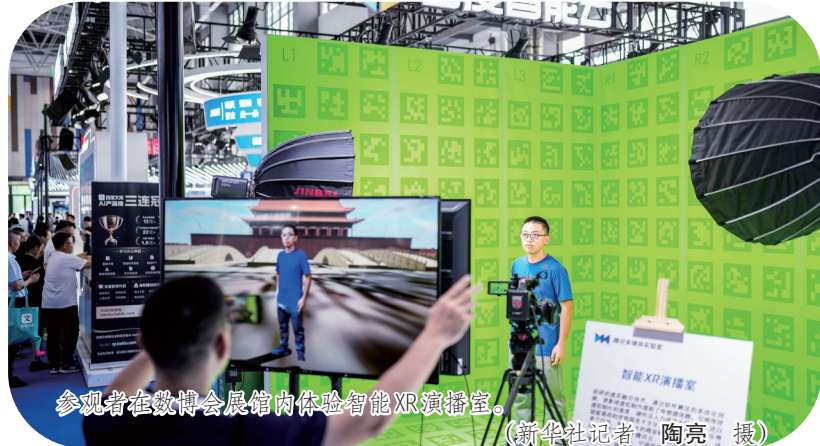
参观者在数博会展馆内体验智能XR演播室。