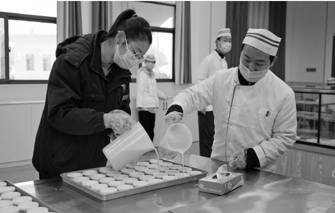
为弘扬雷锋精神和志愿服务精神,3月4日,萍安钢铁团委组织青年志愿者们来到湘东区特殊学校,开展“学习雷锋 关爱特殊儿童”志愿服务活动,与学生们交流互动并送上食品大礼包、学习用品等。图为青年志愿者和学生一起做蛋挞。

推行“信息调查员前端调查+专职调解员中端调解+心理疏导员后端回访”的闭环诉调解纷制度,有针对性地家事案件、涉未成年人案件开展判后跟踪回访,结对帮扶、心理疏导、技能培训、法律咨询、普法宣传、家庭教育等工作。建立“家庭教育领航站”,整合家庭、司法、民政、教育、共青团、社会等力量,将未成年人司法保护与社会保护衔接,搭建立体化家庭教育指导工作体系。2023年,该院受理家事纠纷多元调解案件448件,调撤率达58.6%,对15名涉刑未成年人进行回访25次,开展红色法治宣教13场,辐射辖区未成年人1400余人次。