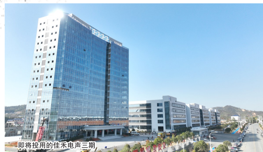
即将投用的佳禾电声三期

卯兔新春，节日氛围格外浓郁。经过短暂休整，赣湘合作产业园里的工人们快速返岗。这个春节，佳禾电声、凯诺威电子、江涑新材料等10余个重大项目，以及伍子醉、丰达兴、联锦成等15个重点企业，全力以赴加班加点赶工期、抢进度、抓生产。 火热的场景，生动诠释“人勤春来早”。选准电子信息作为首位主导产业的上栗县，抢抓列入赣湘区域合作示范区、江西省首批数字经济集聚区的有利契机，朝着打造全国知名电子电路产业集聚区、江西省省级高新工业园区目标阔步前行。