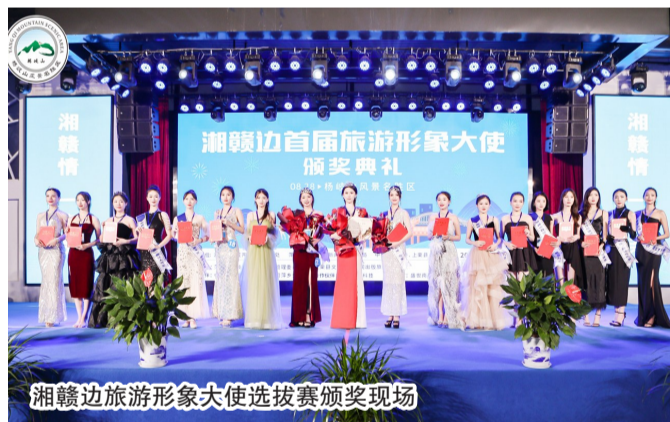
湘赣边旅游形象大使选拔赛颁奖现场

伴随着“组合拳”的发力，2022年，全县花炮总产值重新回归百亿阵营，产值、税收、出口额分别同比增长28.4%、32.3%、72.6%。上栗县文化产业集群入选江西省特色产业集群，“上栗花炮”也获评“最受欢迎的江西十大地域消费品牌”。