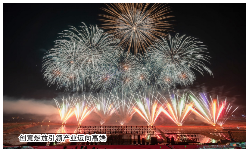
创意燃放引领产业迈向高端