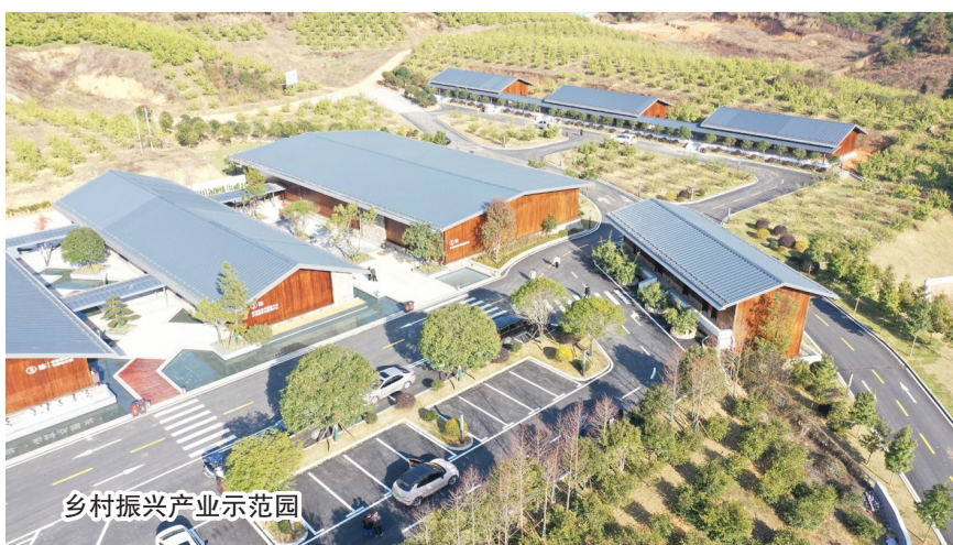
乡村振兴产业示范园