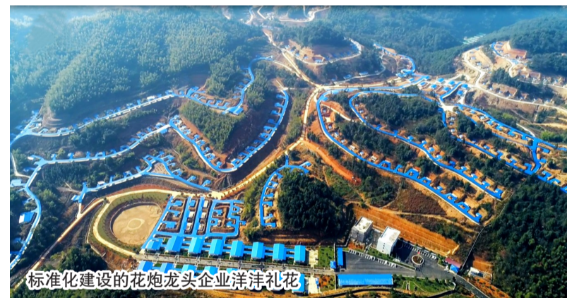
标准化建设的花炮龙头企业洋洋礼花